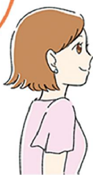
美術館や映画館で涼みながら芸術に触れるのも良いですね♪

ほかにちょっとした工夫で節電に。カーテンやブラインドで直射日光を防ぐとお部屋の快適さもアップ。遮熱カーテンもおすすすめです。暑いと冷蔵庫を開ける回数も増えますが、開けると冷気が外に漏れ、閉めた時に冷やそうと電力を消費するので、開閉の回数を減らすことも大切です。