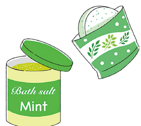
清涼感のある夏向けの入浴剤が豊富にあるのでチェックしてみてください

ほかにちょっとした工夫で節電に。カーテンやブラインドで直射日光を防ぐとお部屋の快適さもアップ。遮熱カーテンもおすすすめです。暑いと冷蔵庫を開ける回数も増えますが、開けると冷気が外に漏れ、閉めた時に冷やそうと電力を消費するので、開閉の回数を減らすことも大切です。